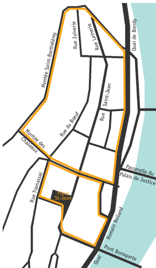
SECTEUR VIEUX LYON